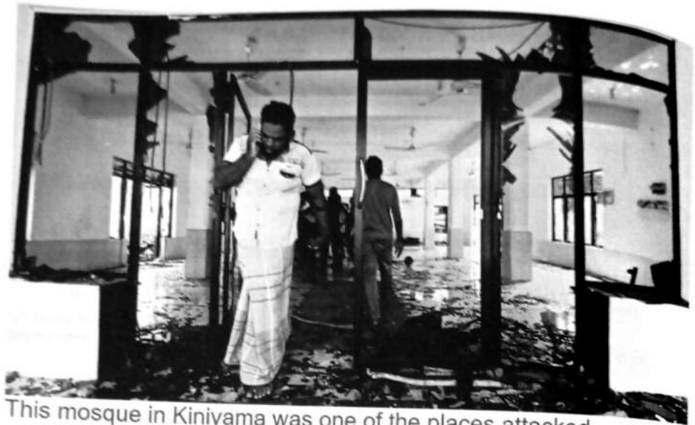
This mosque in Kinyama was one of the places attacked